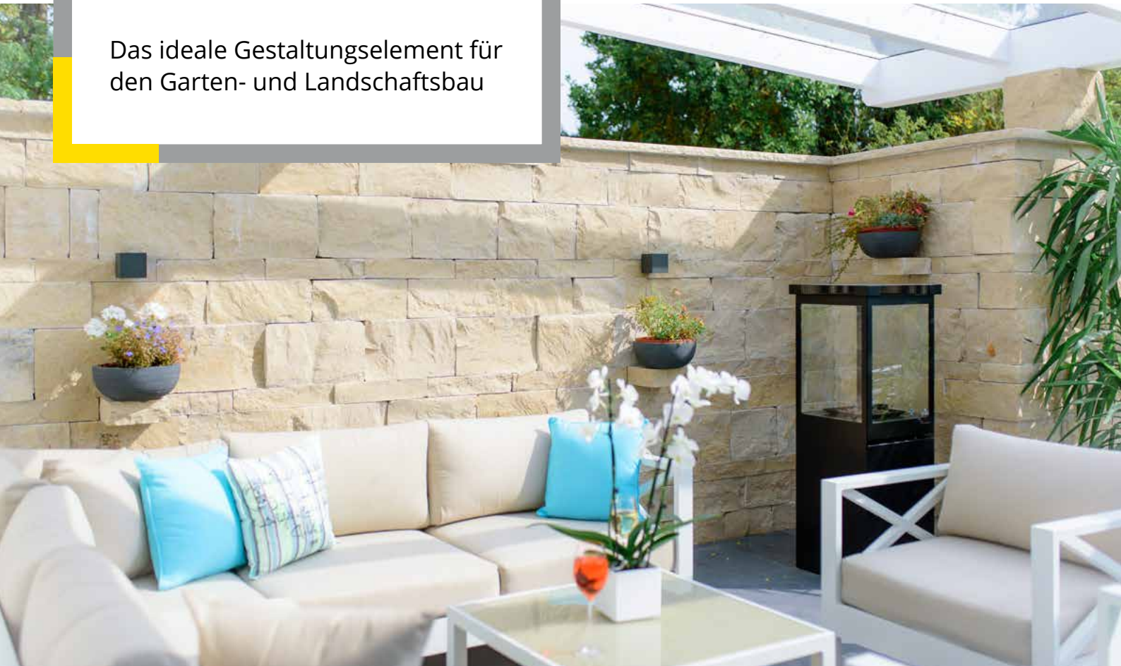
Jura Kalkstein, Schichtmauerwerk, gespalten

Das ideale Gestaltungselement für den Garten- und Landschaftsbau