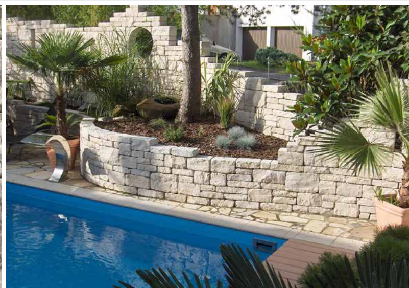
Jura Kalkstein, Systemmauerwerk, getrommelt