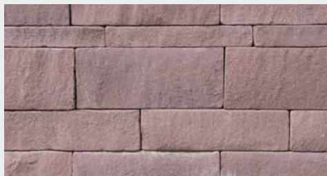
Eichenbühler Sandstein, Schichtmauerwerk

Bei uns erhalten Sie auch System- und Schichtmauerwerk aus Sandsteinen, zum Beispiel: