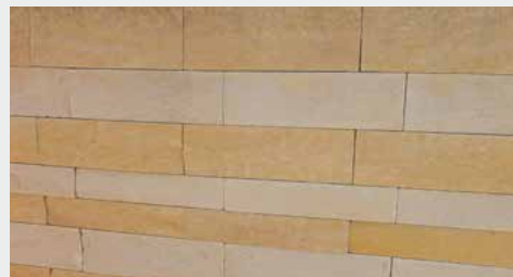
Warthauer Sandstein, Schichtmauerwerk