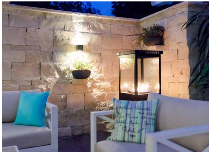
Jura Kalkstein, Schichtmauerwerk, gespalten