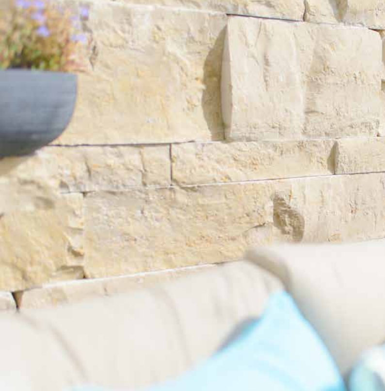
Jura Kalkstein, Schichtmauerwerk, gespalten