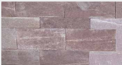
Olsbrücker Sandstein, Schichtmauerwerk