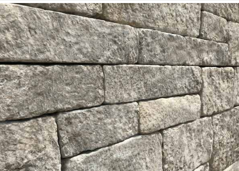
Pfraundorfer Dolomit, Systemmauerwerk, getrommelt